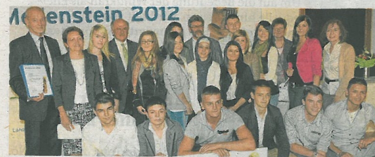
Landeshauptmann Erwin Pröll übergab SchülerInnen und LehrerInnen ihren 1. Schulpreis.