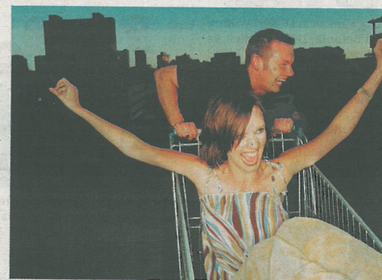
Geöffnet bis 22 Uhr: Die M-City lockt am 15. Juni mit Top-Angeboten zum nächtlichen Einkauf.

Am 15. Juni profitieren Kunden der M-City in Mistelbach von teils spektakulären Rabatten. Bis zu minus 25 % gewähren manche der Geschäfte auf alle Einkäufe.